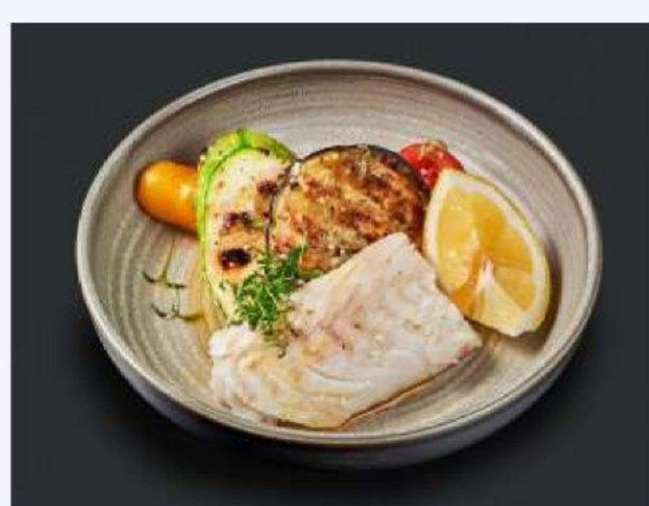
120/120/50 гр. Треска с овощами